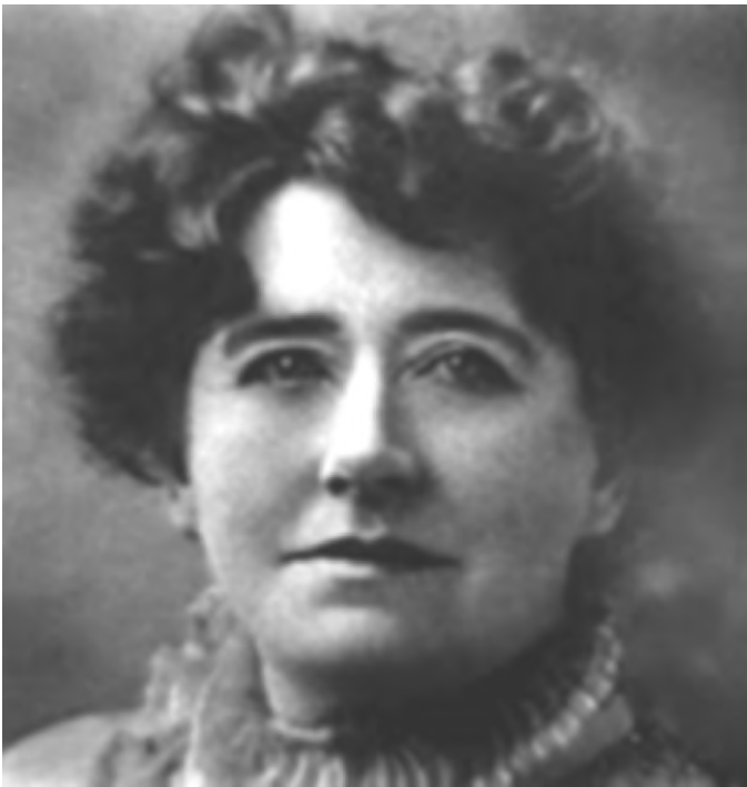
De in haar dagen zeer beroemde Shakespeare-vertolkster Dame Ellen Terry. Ik heb deze foto enigszins verzacht, want de kwaliteit van de foto die ik van het internet haalde was dermate slecht dat het leek of zij heel pokdalig was.